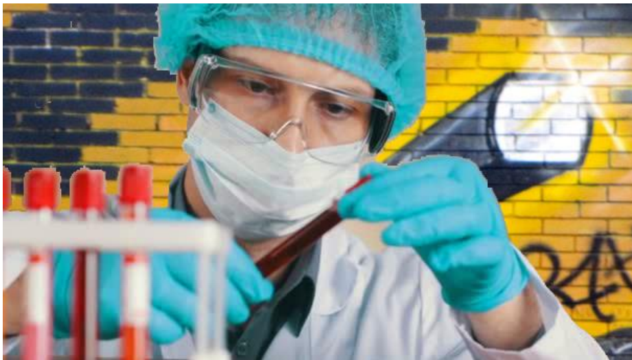
Befragung der weggesperrten Welt

Unermüdlich hat Sir Karl Popper sich bemüht, die Fragwürdigkeit des materialistischen, rationalistischen Standpunktes in allen modernen Problembereichen nachzuweisen. Europas gesamte avantgardistische Kultur versucht und zeigt Wege in die "entgegengesetzte Richtung", in die Lebendigkeit, wo mehr ist als die Summe ihrer Teile, wie auch wir selbst mehr sind als die Summe unserer Zellen, haben wir doch darüber hinaus Geist, Bewusstsein und Denken.