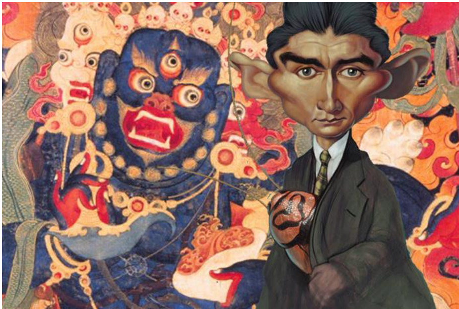
Franz Kafka, Die Verwandlung des Menschen in ein Insekt

Woran Dichter* wie Franz Kafka, Robert Musil, R. M. Rilke, Ingeborg Bachmann, Thomas Bernhard, aber auch gegenwärtige Denker wie Sir Karl Popper, Soziologen* und Psychologen* immer und immer wieder erinnern, wurde über die Zeit achtlos übergangen und manifestiert sich heute in einer Schattengesellschaft, die beinahe oder schon die Mehrheit von uns eingeholt hat.